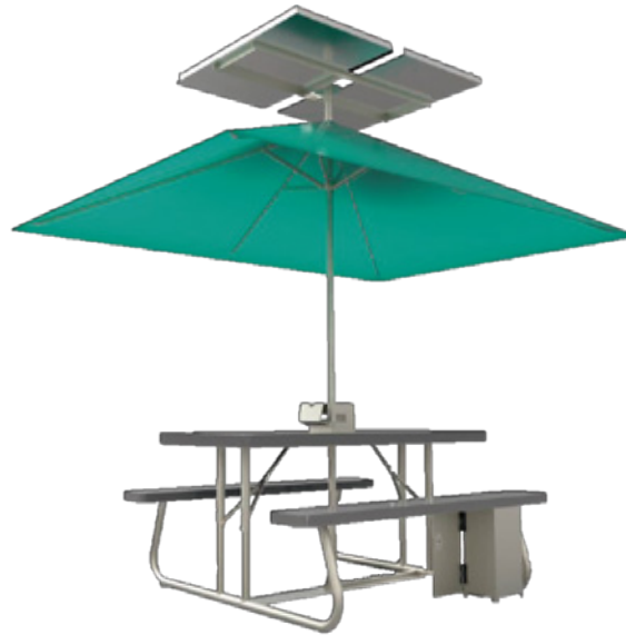
Mesa Solar Picnic