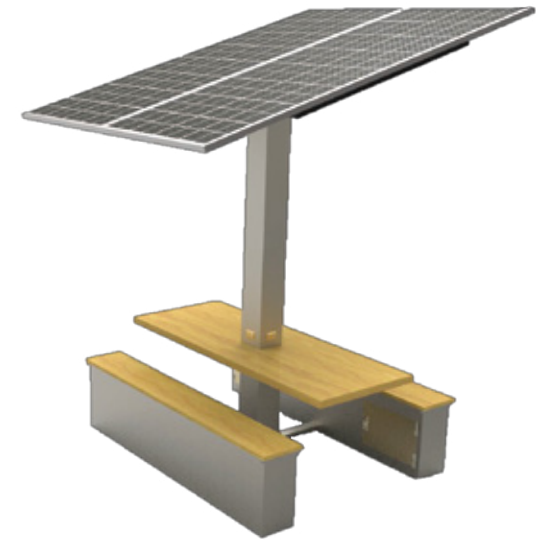
Mesa Solar Plus