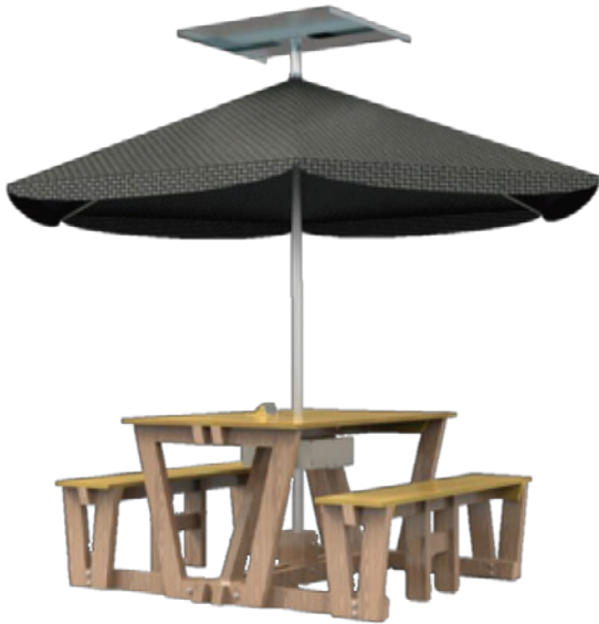
Mesa Solar Eco